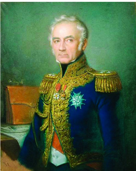
Шарль-Тристан Монтолон (Художник - Edouard Pingret)

«На острове Святой Елены Наполеон, сохранивший юношескую пылкость, в свободные от тяжких раздумий часы наставлял рога товарищу по заключению, храброму генералу де Монтолону. Однако генерал не страдал от этого вероломства. Уже давно он принял решение закрыть глаза на проказы своей супруги. Прекрасная Альбина де Вассаль и вправду обладала столь бурным темпераментом, что, как удачно сострил граф де Берг, „ревность одного мужчины была недостаточной, чтобы дать представление о всех ее шалостях“. Прежде чем Альбина женила на себе Монтолона, она уже дважды побывала замужем, и оба раза браки расторгались из-за адюльтера».