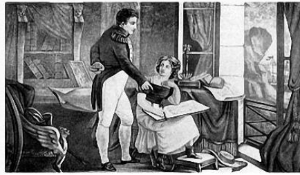
NAPOLEON GETTING SOME 2nd BASE ACTION WITH ALBINE MONTHOLON

Альбина де Монтолон была на десять лет младше Наполеона, и Ги Бретон уверен, что она была его любовницей. Он пишет: