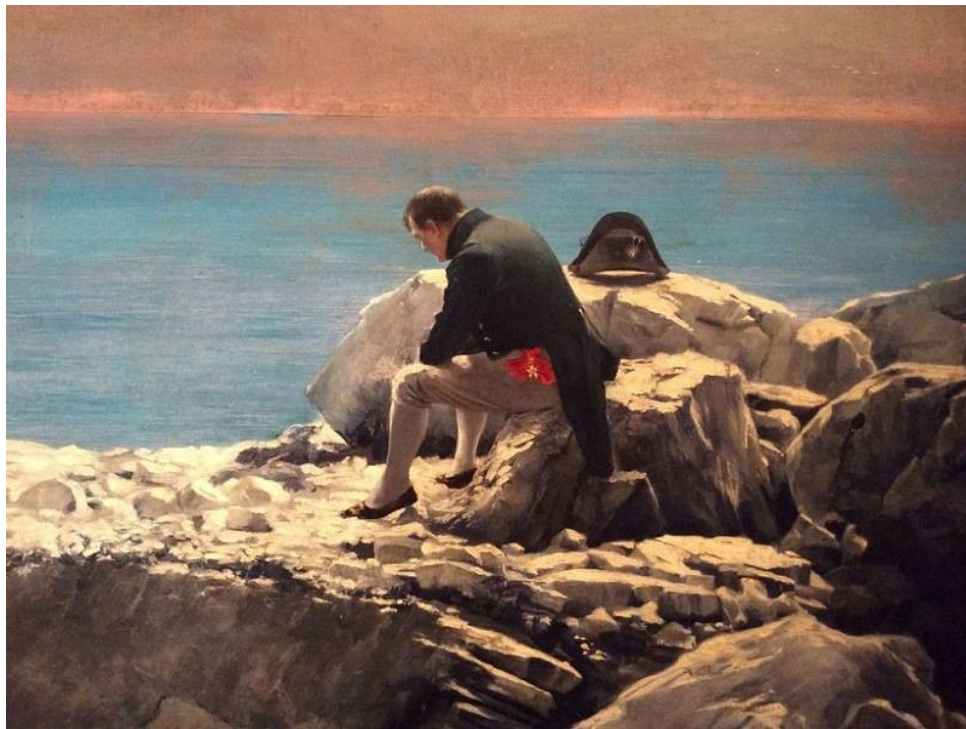
Oscar Reix, «C'est fini: Napoléon Ier à Sainte-Hélène»

Шарль-Тристан де Монтолон - личный адъютант Наполеона, последовавший за низложенным императором на остров Святой Елены. Наполеону было разрешено выбрать офицеров в сопровождающие, вместе с женами их было всего 27 человек.